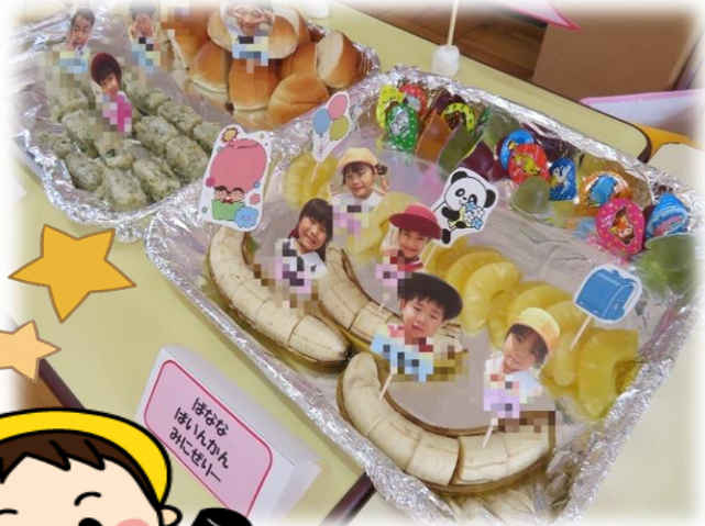
みんな ほくのお顔 のピック