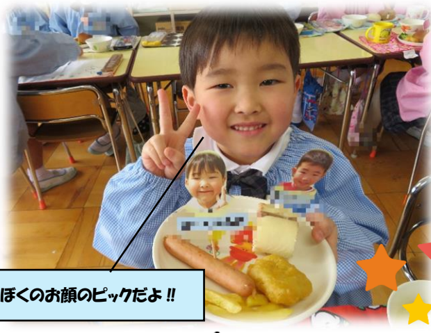
ほくのお顔のピックだよ!!