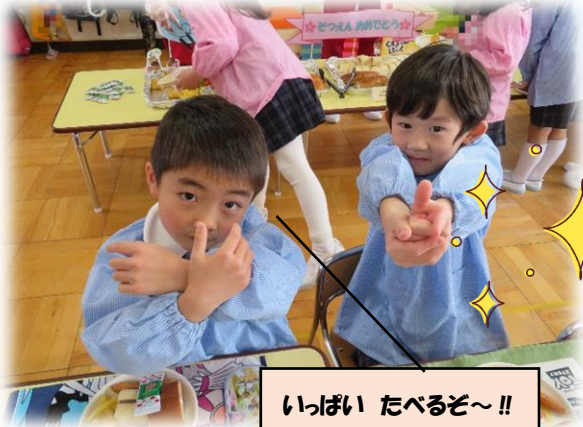
いっぱい たべるぞ~!!