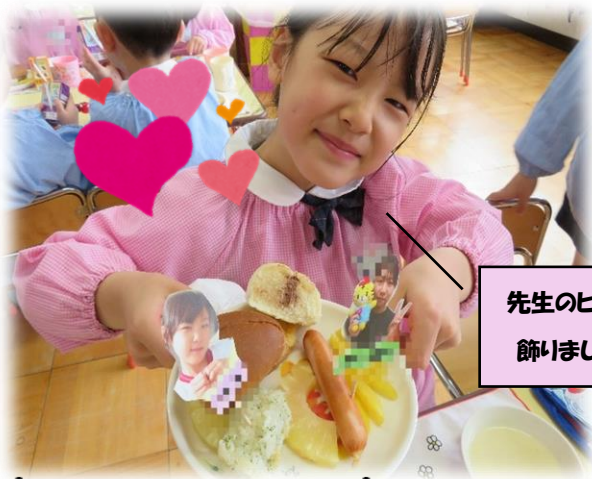
先生のピックも飾りました♪